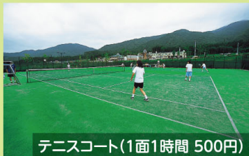
テニスコート(1面1時間 500円)