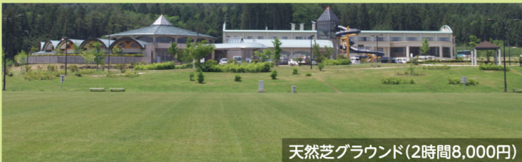
天然芝グラウンド(2時間8,000円)